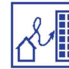
Sociaal veilige woon/werk-route