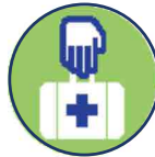
Diefstal eigendommen ziekenhuis