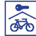
Afsluitbare of bewaakte fietsenstalling