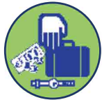
Diefstal persoonlijke eigendommen