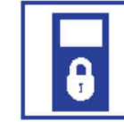
Fysieke beveiliging in- en uitgangen en ramen