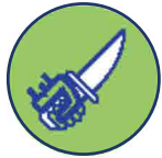
Bedreiging met wapen