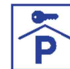
Afsluitbare of bewaakte parkeerplaatsen