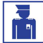
Fysieke aanpak kwetsbare plekken