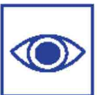
Toezichthouders in/rond zorginstelling