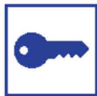
Afsluiten (delen van het gebouw)