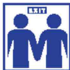
Afspraken gezamenlijk verlaten gebouw