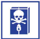
Opbergen gevaarlijk materiaal